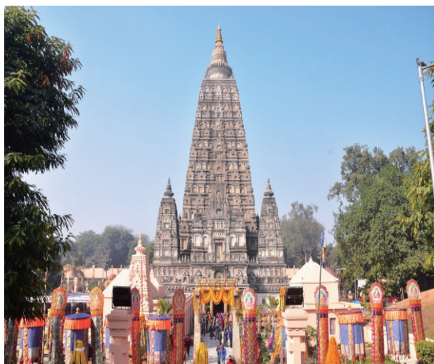
釈尊成道の町、ブダガヤの大塔

※純正寺住職還暦の記念に、有縁の僧侶・ご門徒と共に釈迦さまのご生涯を訪ねる旅を計画しました。25年前、初めて仏跡を旅した時の感動は、今でも忘れることができません。仏教徒として、このチャンスをどうぞお見逃しなく。詳しくはパンフレットで。お申し込み、お問い合わせは純正寺住職まで。