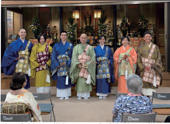
純正寺所属の僧侶のみの内陣出勤でお勤め