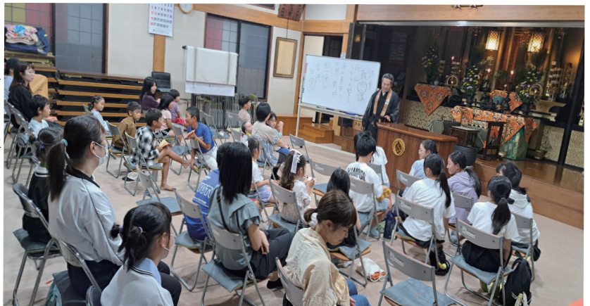
昼間参拝の大人の人数よりも、子ども報恩講の方が多(笑)

お勤め終了後には、今回得度いたしました二人がご参拝のご門徒に向けてご挨拶させていただきます、「僧侶と