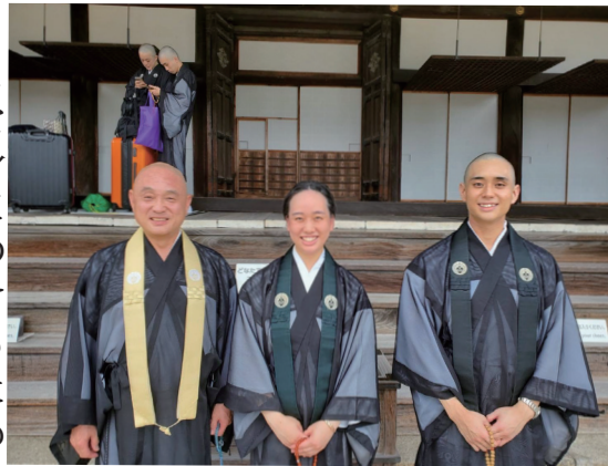
無事得度習礼を終えて、西山別院本堂前で

ことを身につけるための、十一日間の合宿のことです。期間中、習礼生は厳しい鍛錬を受けます。正信念仏偈・和讃は、正確な音程で勤められるよう指導され、正信念仏偈は暗記しなければなりません。さらに、正信念仏偈はお勤めだけでなく、その内容についても詳しく学びます。