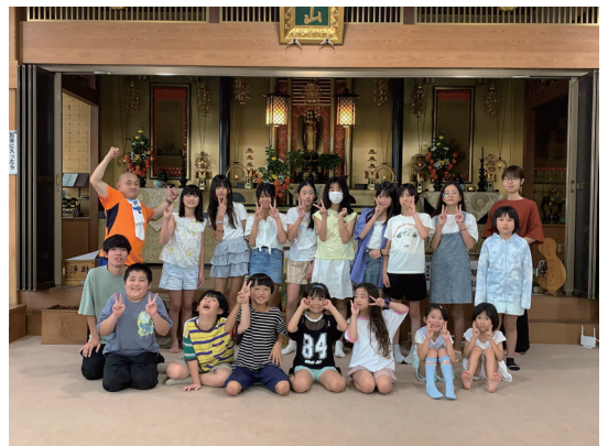
最後まで元気な笑顔が最高だった子ども達

翌日は五時起床。洗面と着替えを済ませた子ども達は、お同行と共に正信偈和讃のお朝事のお勤めです。ラジオ体操をして、自分で作ったおむすびの朝食を満喫。あつという間の夏休み最後の楽しい時間を過ごして、元気に解散しました。