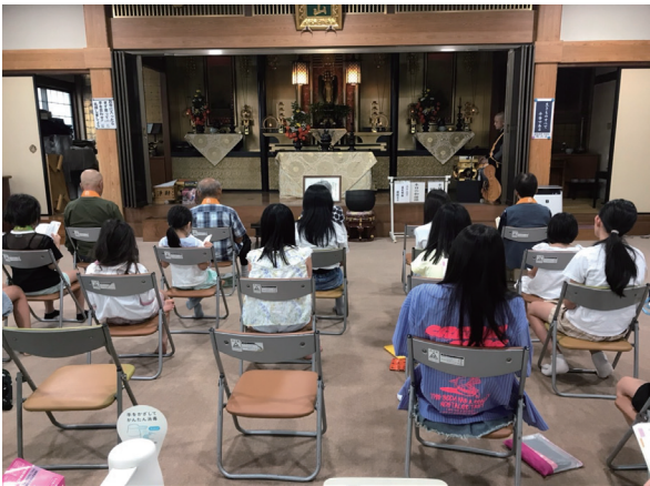
寝不足であくびをしながらのお朝事でした

グループに分かれた子ども達は、それぞれのたこ焼き器に生地を入れ、たこ・めんたい・チーズ・ウインナーなどの具を入れたたこ焼きを口いっぱいお腹いっぱい食べました。ベビーカーラのおまけまで作った大満足の夕食となりました。 満腹になったら、保護者さんの運転する車に分乗して、「極楽湯」での入浴です。ワイワイ楽しい入浴のあとは、本堂でアイスを食べながらのアニメ視聴です。仏