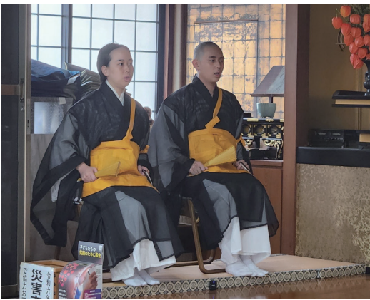
帰宅翌日の純正寺お朝事で内陣初出勤