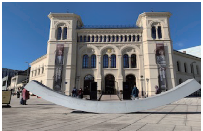
オスロ市庁舎前にあるノーベル平和記念館

罪を犯したものが自由を拘束されたり（禁錮）、作業をさせられたり（懲役）する「刑罰」を受けるところ、つまり「お仕置き部屋」のような場所でした。しかし、この刑法の改正により、懲役刑・禁錮刑が廃止され「拘禁刑」に一本化することに、刑務所が刑罰を受けるところではなく、再犯す