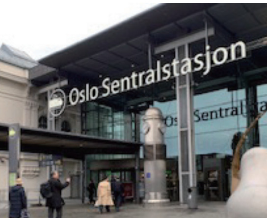
この旅の起点となった美しきオスロ中央駅

さて、日本の刑務所を出所した人が再び罪を犯す確率「再犯率」は約五〇パーセントです。これは、世界各国の再犯率と比較すると平均的な数字です。では、世界一再犯率が低い国はどこかというところ、北欧の国ノルウェーで、その再犯率は二〇パーセントです。しかし、実は三十年以上前までは、ノルウェーの再犯率は日本よりも高い六〇〜七〇パーセントでした。それが、この三十年の間に二〇パーセントまで押さえ込むことに成功したのです。その理由は、まさしく修復的司法の導入でした。その結果、ノルウェーでの修復的司法の導入は、刑務所を大きく改革させたのでした。