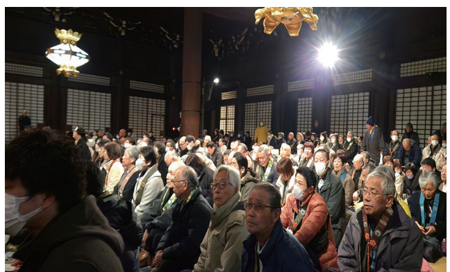
寒い夜明け前の御影堂に満堂のお念仏の熱気

ていただきました。 ご法話が終わると、午前 六時から本堂でのお朝事。 一年で、この日の朝だけ勤 まる「真譜」でのお正信偈。 まだ夜明け前の御影堂に、 満堂のお勤めの声は幾重に も響き渡っていました。純 正寺代表の三名のご門徒方 は、午前十時からの「満日 中法要」にも参拝されま した。尊い仏縁でした。