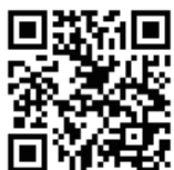
YouTube 純正寺チャンネル

純正寺の法要は「YouTube」で、常朝事は「facebooklive」で、それぞれ生配信でも録画でもご参拝・お聴聞していただけます。下記のQR(二次元)コードを、スマホのQRコードリーダーで読み込んでください。