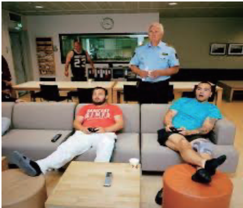
刑務官と被収容者が一緒にテレビ視聴

というものです。どれ一つをとっても、日本の刑務所では全く保障されていない権利なのです。